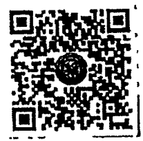
QR Code แบบรายงานข้อมูล

สำนักงำน ก.จ. ก.ท. และ ก.อบต. พิจารณาแล้ว ในระหว่างวันที่ ๑ - ๓๑ ตุลาคม ๒๕๖๖ ได้มีข้าราชการ หรือพนักงานครูและบุคลากรทางการศึกษาของครุปกครองส่วนท้องถิ่นยื่นคำขอรับการประเมินเพื่อเลื่อน วิทยฐานะสูงขึ้นระดับชำนาญการพิเศษและเชี่ยวชาญ ตามมาตรฐานทั่วไปเดิม (ประกาศ ก.ท. เรื่อง หลักเกณฑ์ และเงื่อนไขการประเมินผลงานพนักงานครูและบุคลากรทางการศึกษาเทศบาลเพื่อมีหรือเลื่อนวิทยฐานะ ลงวันที่ ๕ มกราคม พ.ศ. ๒๕๕๐) ซึ่ง ก.จ. และ ก.อบต. กำหนดให้อนุโลมใช้กับองค์การบริหารส่วนจังหวัด และองค์การบริหารส่วนตำบลเช่นเดียวกัน ดังนั้น เพื่อให้การประเมินดังกล่าว เป็นไปด้วยความเรียบร้อย ถูกต้อง และเหมาะสม จึงขอความร่วมมือสำนักงำน ก.จ.ก. ก.ท.ก. ก.อบต.จังหวัด ทุกจังหวัด และสำนักงำน ก.เมืองพัทยา แจ้งองค์กรปกครองส่วนท้องถิ่นที่มีผู้ยื่นคำขอรับการประเมินเพื่อเลื่อนวิทยฐานะสูงขึ้นระดับ ชำนาญการพิเศษและเชี่ยวชาญ ในรอบเดือนตุลาคม ๒๕๖๖ และผ่านการประเมินด้านวินัย คุณธรรม จริยธรรม และจรรยาบรรณวิชาชีพ และด้านคุณภาพการปฏิบัติงาน แล้ว รายงานข้อมูลผู้ที่จะจัดส่งผลงานที่เกิดจาก การปฏิบัติหน้าที่ (ผลการปฏิบัติงานและผลงานทางวิชาการ) ต่อสำนักงำน ก.จ. ก.ท. และ ก.อบต. เพื่อกำหนด แผนในการจัดส่งให้คณะกรรมการประเมินผลงานต่อไป โดยให้รายงานข้อมูลผ่านระบบออนไลน์จากการสแกน QR Code ท้ายหนังสือนี้ ภายในวันที่ ๒๕ กุมภาพันธ์ ๒๕๖๗ ทั้งนี้ สำนักงำน ก.จ. ก.ท. และ ก.อบต. จะดำเนินการรับผลงานที่เกิดจากการปฏิบัติหน้าที่ (ผลการปฏิบัติงานและผลงานทางวิชาการ) ของผู้ขอรับ การประเมินดังกล่าว ในระหว่างวันที่ ๒๕ - ๒๖ มีนาคม ๒๕๖๗ เวลา ๐๘.๓๐ - ๑๖.๓๐ น. ณ โรงเรียน เทศบาลท่าโขลง ๑ ตำบลคลองสอง อำเภอกลองหลวง จังหวัดปทุมธานี