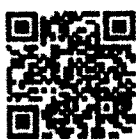
รายชื่อรุ่นที่ ๒

สำนักบริหารการคลังท้องถิ่น กลุ่มงานการจัดสรรเงินอุดหนุนและพัฒนาระบบงบประมาณ โทรศัพท์/โทรสาร ๐ ๒๒๕๓ ๙๐๔๔ ไปรษณีย์อิเล็กทรอนิกส์ saraban@dla.go.th