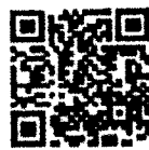
รายชื่อรุ่นที่ ๓