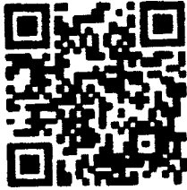
สแกนสั่งซื้อ

(ลงชื่อ)..... (.....) ตำแหน่ง..... วันที่.....เดือน.....พ.ศ.๒๕๖๗