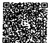
บัญชีวัดเทพประทาน

เนื่องจากบางครั้งเกิดเหตุขัดข้อง โดยที่ไม่ได้รับเอกสาร