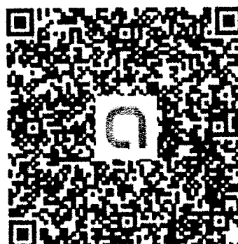
QR Code ไลน์กลุ่ม

หมายเหตุ : กรณีเข้าไม่ได้ให้กดข้ามโฆษณา (Skip advertisement)