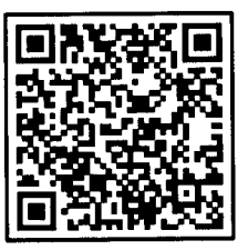
QR-Code ติดต่อเจ้าหน้าที่ @59training

ผู้อำนวยการสำนักงานบริการวิชาการ ปฏิบัติการแทนอธิการบดีมหาวิทยาลัยศิลปากร