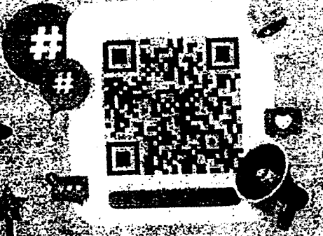
ลงทะเบียนเข้าร่วมประชุมฯ