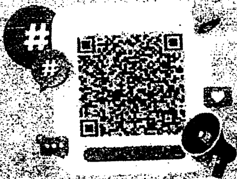
เอกสารโครงการฯ

โรงเรียน ครู และนักเรียน ที่เข้าร่วมจะได้รับ เกียรติบัตร