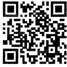
QR Code คู่มือฯ

ปลัดอำเภอ (จพง.ปค.ชำนาญการพิเศษ) รักษาการแทน นายอำเภอมแม่สาย