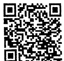
เอกสารประกอบการประชุม