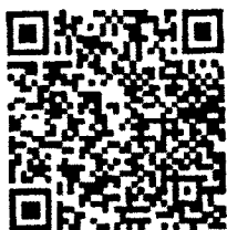
แบบตอบรับเข้าร่วมประชุม