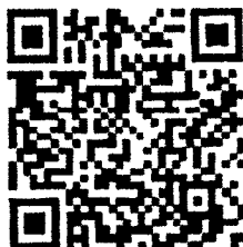
Zoom meeting ID: 946 1755 2957 Password: 1111