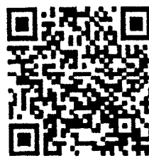
Facebook live: สื่อสารความเฝ้า สคร.1 เชียงใหม่