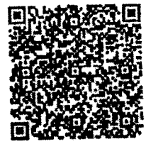
ลิงก์ส่งมาด้วย

กรมส่งเสริมการปกครองท้องถิ่นพิจารณาแล้วเห็นว่า เพื่อเป็นการเฝ้าระวังและเตรียมความพร้อมรับมือกับสถานการณ์เหตุเพลิงไหม้ที่อาจเกิดขึ้นในสถานที่กำจัดขยะมูลฝอยในช่วงเวลาดังกล่าว รวมทั้งเพื่อกำหนดมาตรการแนวทางในการป้องกันปัญหาที่จะเกิดขึ้น จึงขอให้จังหวัดประชาสัมพันธ์คู่มือแนวทางการระงับเหตุไฟไหม้ในสถานที่กำจัดขยะมูลฝอยและสื่อประชาสัมพันธ์ห้องคัดกรองส่วนท้องถิ่นในพื้นที่พิจารณาศึกษาและใช้ประโยชน์ต่อไป ทั้งนี้ หากเกิดเหตุไฟไหม้ในสถานที่กำจัดขยะมูลฝอยในพื้นที่ ขอให้รายงานสถานการณ์ให้กรมส่งเสริมการปกครองท้องถิ่นทราบทันที รายละเอียดปรากฏตาม QR Code ที่ปรากฏท้ายหนังสือฉบับนี้